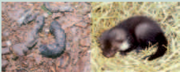
Jungmarder im Stroh